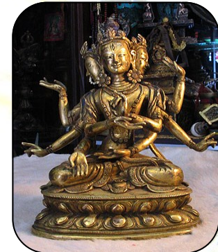
Tibetan goldface statues