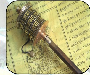
Tibetan religious ritual items