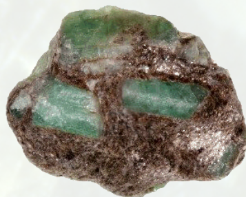
Smaragdkristallen in moedergesteente

Colombia / Madagaskar / Canada / Rusland