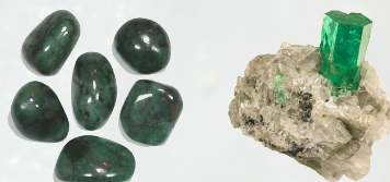
Smaragd trommelstenen en kristal